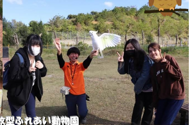
世界最大級の開放型ふれあい動物園 ネオパークオキナワ