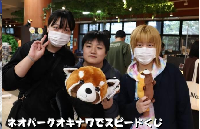
ネオパークオキナワでスピードくじ