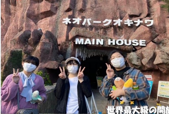
ネオパークオキナワ MAIN HOUSE