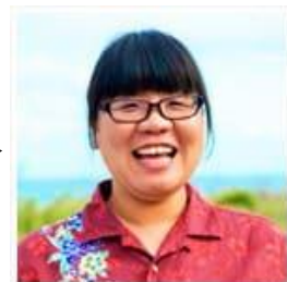
芸能スポーツ/海外(島袋)クラス

みなさん、こんにちは。沖縄では1年で一番寒い時期となり、学校周辺では日本一早い桜が咲き始めています。こんな時期のおススメはツムラの薬湯という入浴剤です(^_^♪身体が芯から温まりぐっすり眠れるのでお試しあれ。 また学習に関してや進路に関して何かあればいつでも相談にのりますので遠慮なく連絡くださいね~(^_-)-☆