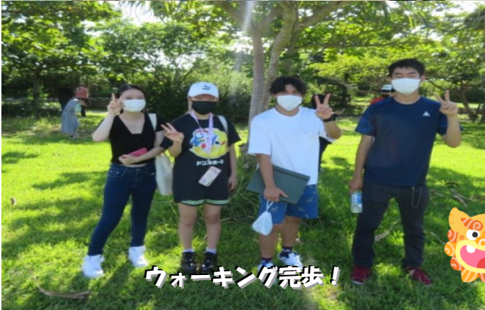
ウォーキング完歩!