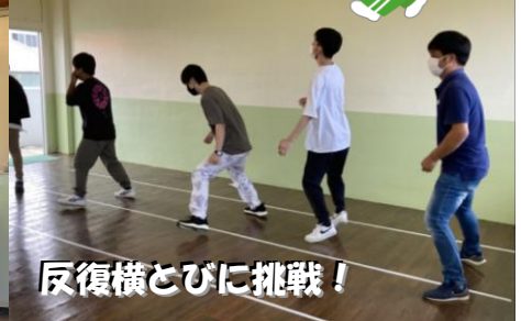
反復横とびに挑戦!