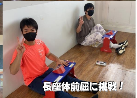
長座体前屈に挑戦!