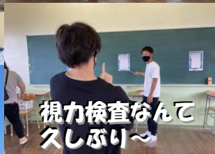
視力検査なんて 久しぶり〜