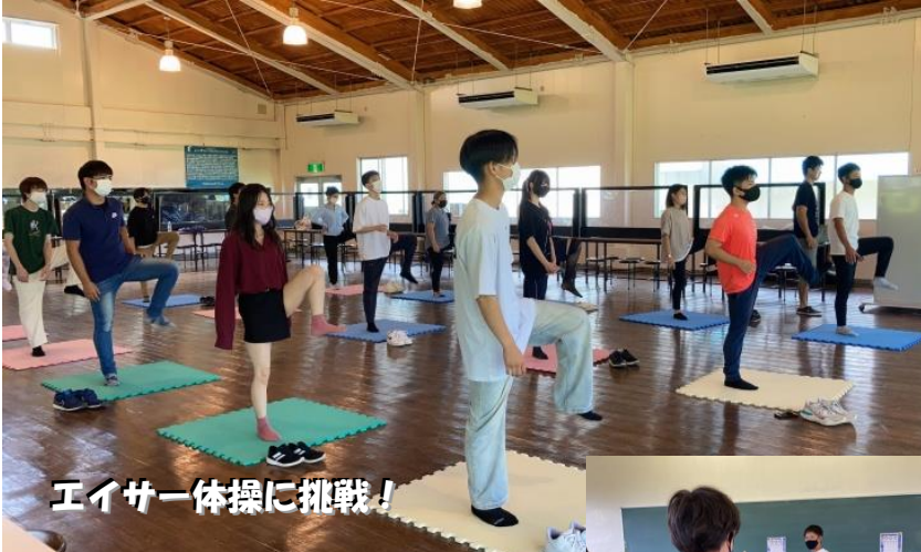
エイサー体操に挑戦!