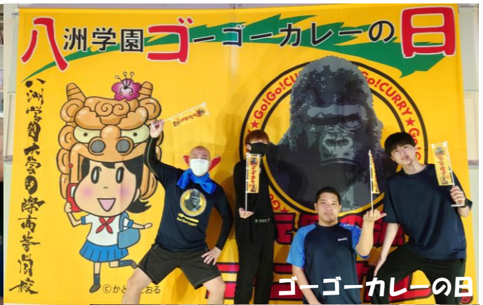
ゴーゴーカレーの日