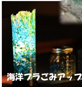
海洋プラスチックアップサイクル