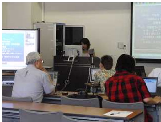
写真左 ライブ配信受講時のパソコン画面 写真右 来校受講の様子